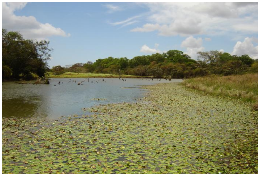
Fig. 2. Vista del reservorio Los Ponchos

No se realiza pesca en este cuerpo de agua.