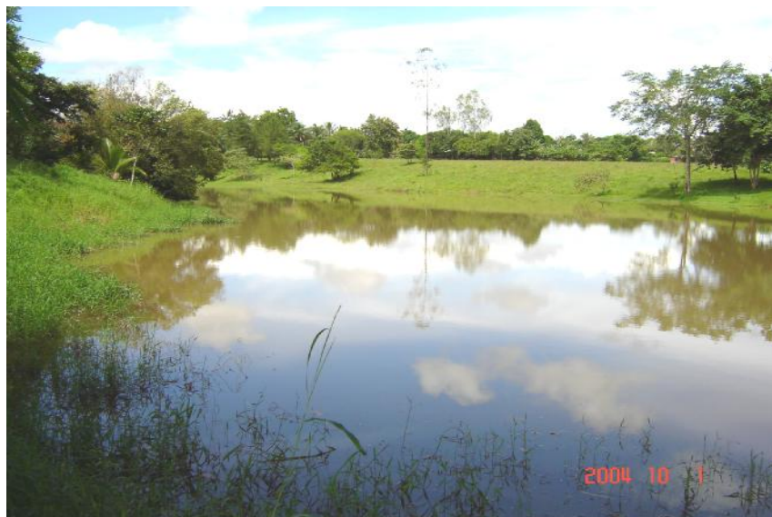
Fig. 2. Vista del reservorio Maloff

El reservorio es de uso privado y es utilizado para riego y recreación privada.