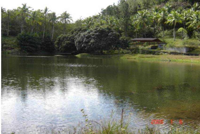
Fig. 2. Vista del reservorio Shangrila

Las características físico-químicas del agua presentan concentraciones en promedio de 6 mg/l para el oxígeno disuelto y temperatura de 30°C. (PREPAC a, 2005) (Fig. 2)