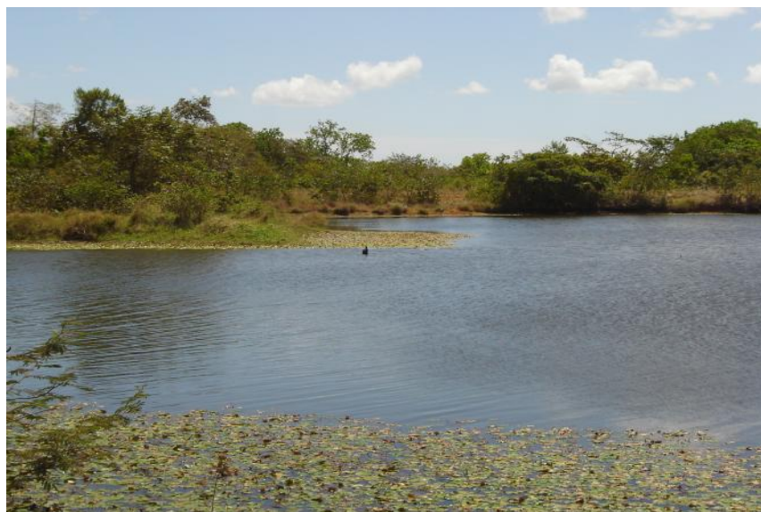
Fig. 2. Vista del reservorio Tanara 1

No se realiza pesca en este cuerpo de agua.