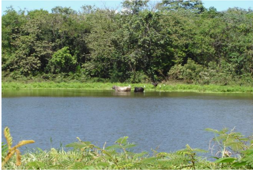
Fig. 2. Vista del reservorio Tanara 2

No se realiza pesca en este cuerpo de agua.