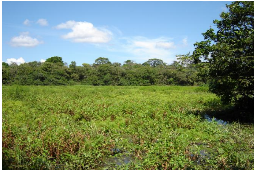
Fig. 3 Plantas acuáticas presentes

No hay referencia de sedimentación ni de contaminación.