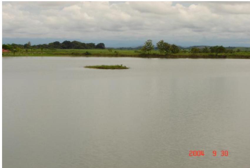
Fig. 2. Vista del reservorio, UP-57

No existe actividad pesquera, ya que el reservorio es de uso privado, dedicado al riego y la recreación privada.