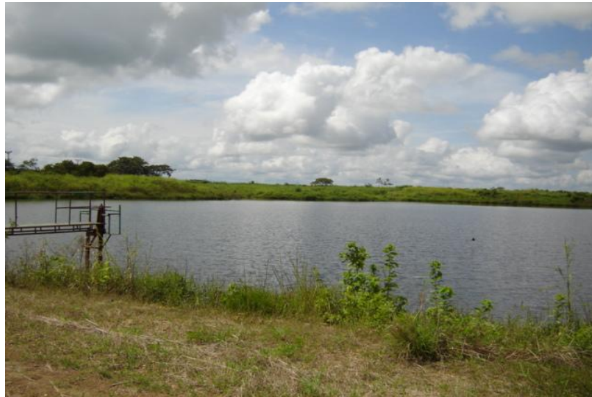
Fig. 2. Vista del reservorio, UP-81

La pesca es realizada en el reservorio por 11 pescadores, que utilizan como arte de pesca 5 anzuelos y líneas y 6 atarrayas, con una producción de 700 y 930 kilos anuales respectivamente. (Iván Álvarez, 2004, comunicación personal)