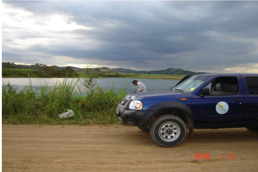
Fig. 2. Vista del reservorio, UP-82

La pesca es realizada en el reservorio por 10 pescadores, que utilizan como arte de pesca 6 anzuelos y líneas y 4 atarrayas, con una producción de 800 y 900 kilos anuales respectivamente. (Iván Alvarez, 2004, comunicación personal)