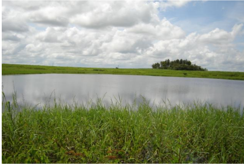
Fig. 2. Vista del reservorio, UP-85

La pesca es realizada en el reservorio por 11 pescadores, que utilizan como arte de pesca 6 anzuelos y líneas y 5 atarrayas, con una producción de 750 y 1,800 kilos anuales respectivamente. (Iván Álvarez, 2004, comunicación personal)