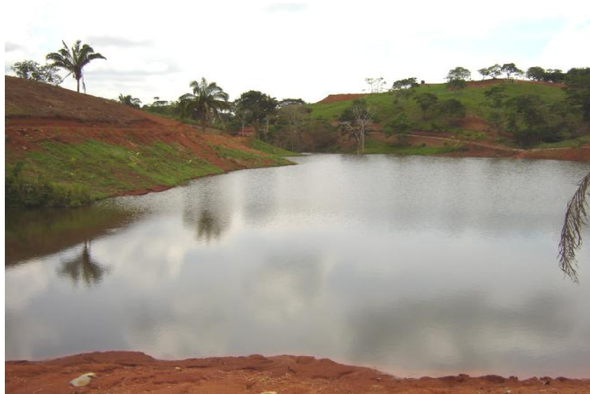
Fig. 2. Vista del reservorio Villa Gina

No hay actividad pesquera ni acuícola por lo cual tampoco se han establecido infraestructuras para dicho propósito.