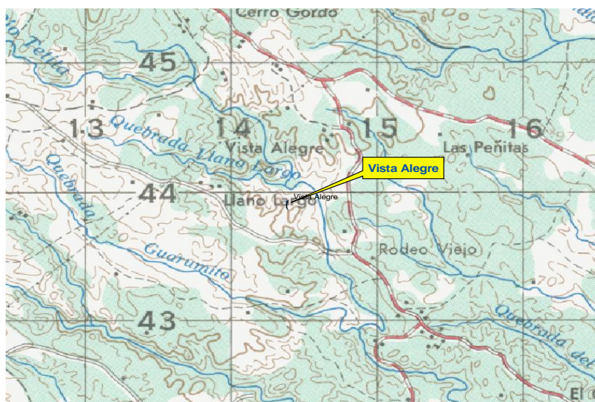
Fig. 1. Ubicación del reservorio Vista Alegre,

Se clasifica como reservorio, de acuerdo a la clasificación del PREPAC, cuenta con una superficie 0.01 kilómetros cuadrados ( 10,000\text{m}^2 ), localizado en la comunidad de Vista Alegre, corregimiento de San José, distrito de San Carlos, provincia de Panamá, a los 8^{\circ}32'17.4'' de latitud norte y 79^{\circ}57'37.2'' de longitud oeste lo que representa en coordenadas UTM 943887 N y 614409.16 E (Int.. Geo. Nal Tommy Guardia, 2004; Censo 2000) (Fig. 1)